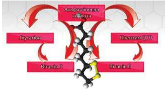
Рис. 2. Потенціуюча дія АЛК на основні антиоксидантні клітинні системи

Є дані, що АЛК ефективніша щодо усунення окислювального стресу, ніж вітаміни С і Е (El-Senousey H.K. et al., 2018). Однак за наявності цих сполук у клітинах АЛК сприяє прояву ними антиоксидантної активності (рис. 2).